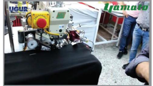
FAST AND CLEAN