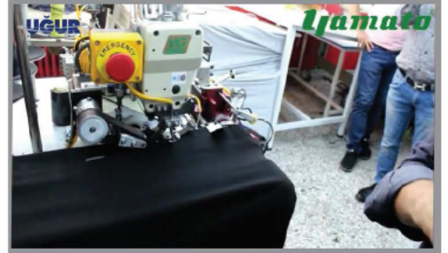
FAST AND CLEAN