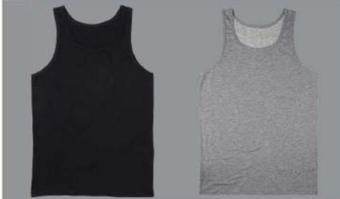
EASY USE AND HANDLING