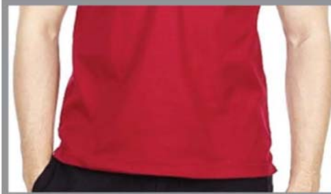
EASY USE AND HANDLING