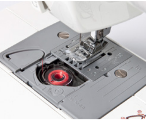
Sadece dolu bir masurayı bırakın.