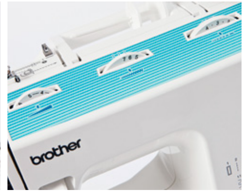
Merkezi olarak yerleştirilmiş iplik tansiyonu ayarları.